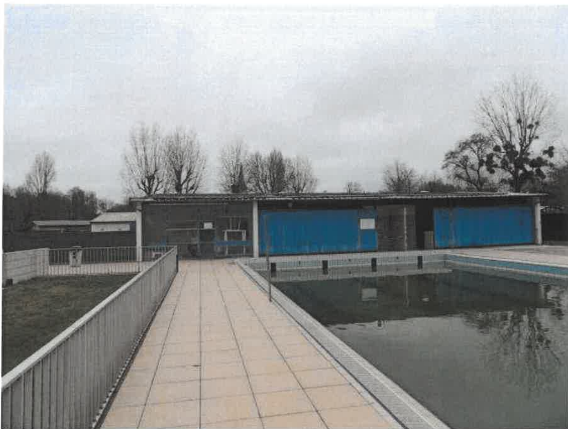
Photo du bassin et du bâtiment