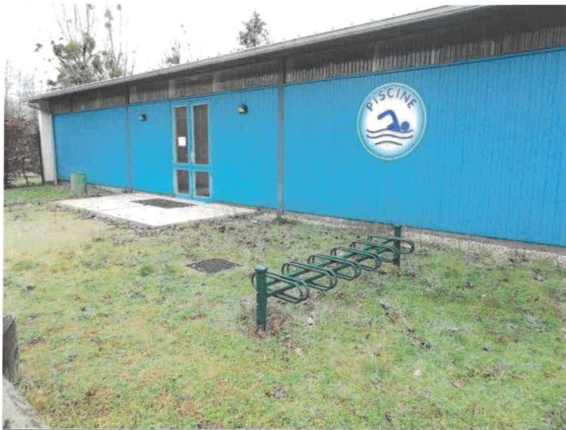
Photo de l'entrée de la piscine